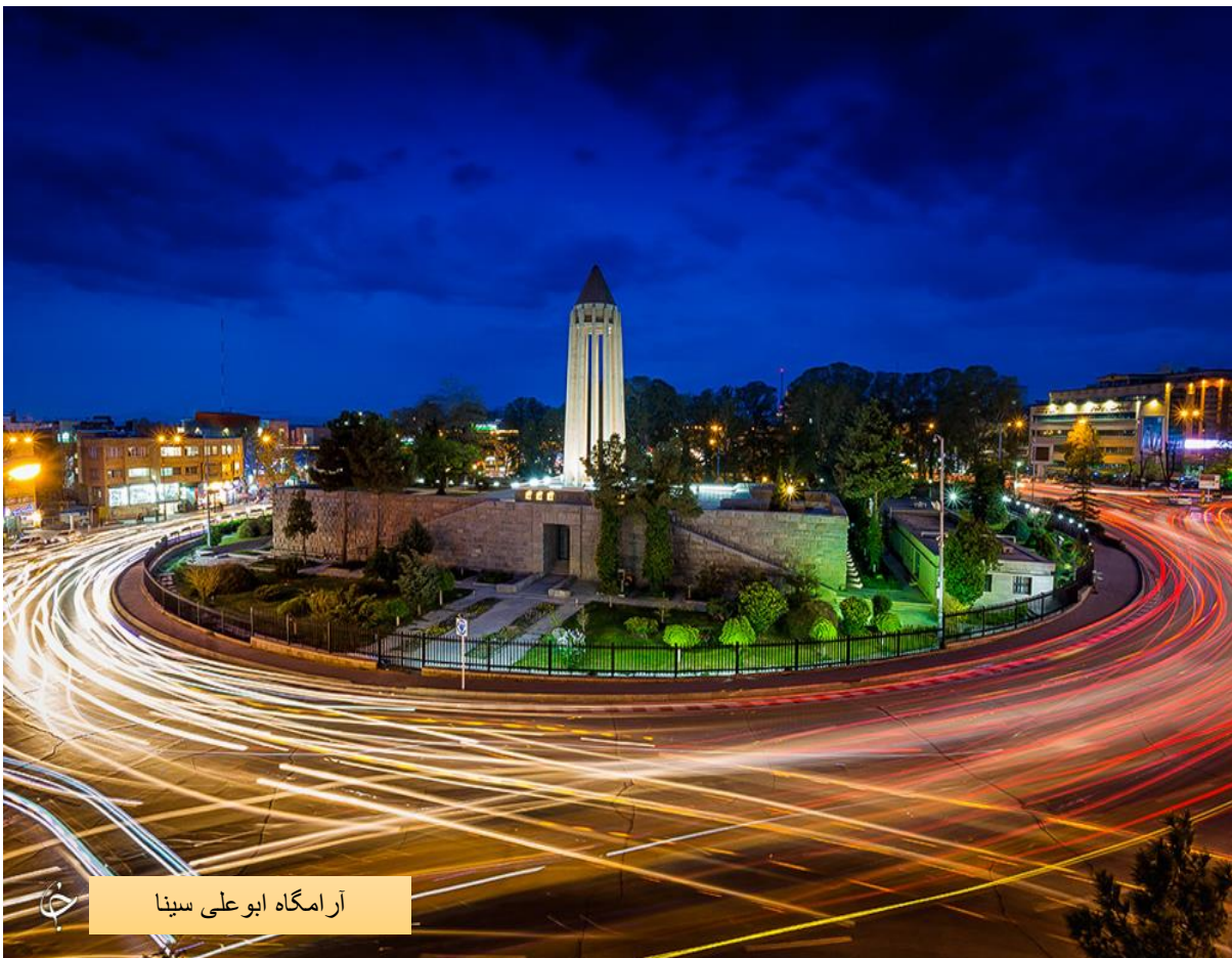
آرامگاه ابوعلی سینا

استان همدان یکی از استان‌های ایران است. مرکز این استان، شهر همدان است. استان همدان از لحاظ جمعیت، چهاردهمین و از لحاظ مساحت، بیست و سومین استان کشور محسوب می‌گردد. جمعیت این استان بر پایه سرشماری سال ۱۳۹۵ بالغ بر ۱,۷۵۸,۲۶۸ نفر بوده‌است. شهرستان این استان عبارتند از: همدان، ملایر، نهاوند، تویسرکان، اسدآباد، کیودراهنگ، رزن، بهار، فامنین همدان با ۲۰,۱۷۳ کیلومتر مربع وسعت، از سمت شمال به استان‌های زنجان و قزوین، از سمت جنوب به استان لرستان، از سمت شرق به استان مرکزی و از سمت غرب به استان‌های کردستان و کرمانشاه محدود می‌شود.