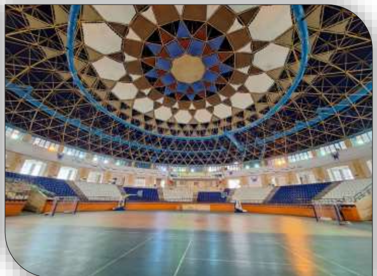
محل برگزاری مسابقات دانشگاه آزاد اسلامی تهران مرکز، سالن امام علی (ع)