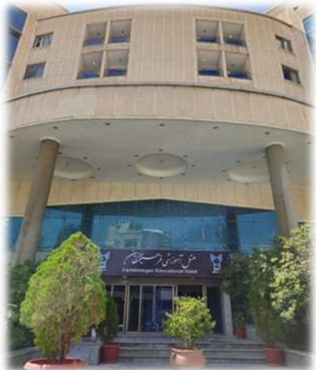
محل اسکان (هتل فرهیختگان)